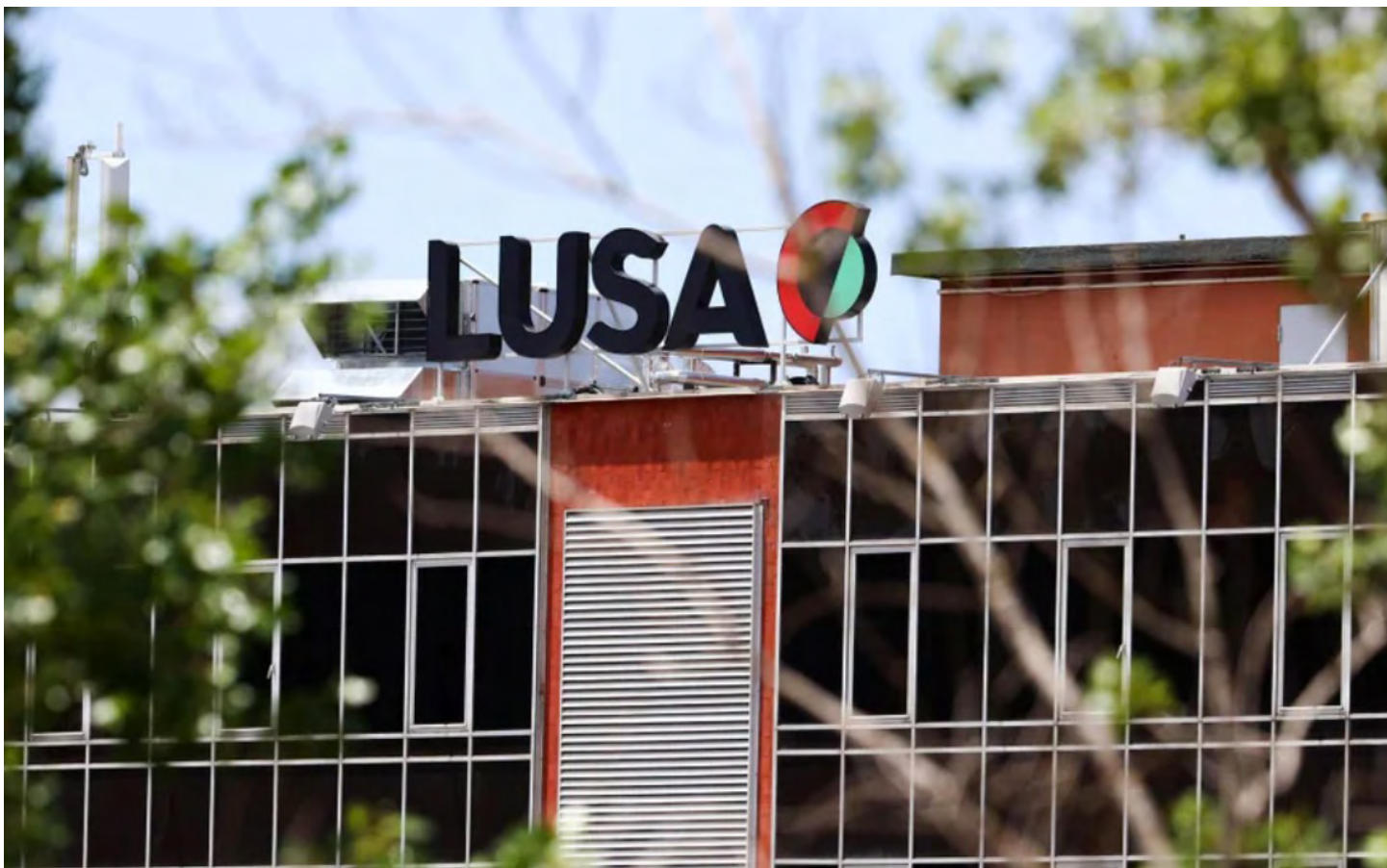
Alteração do perfil estratégico da Agência Lusa