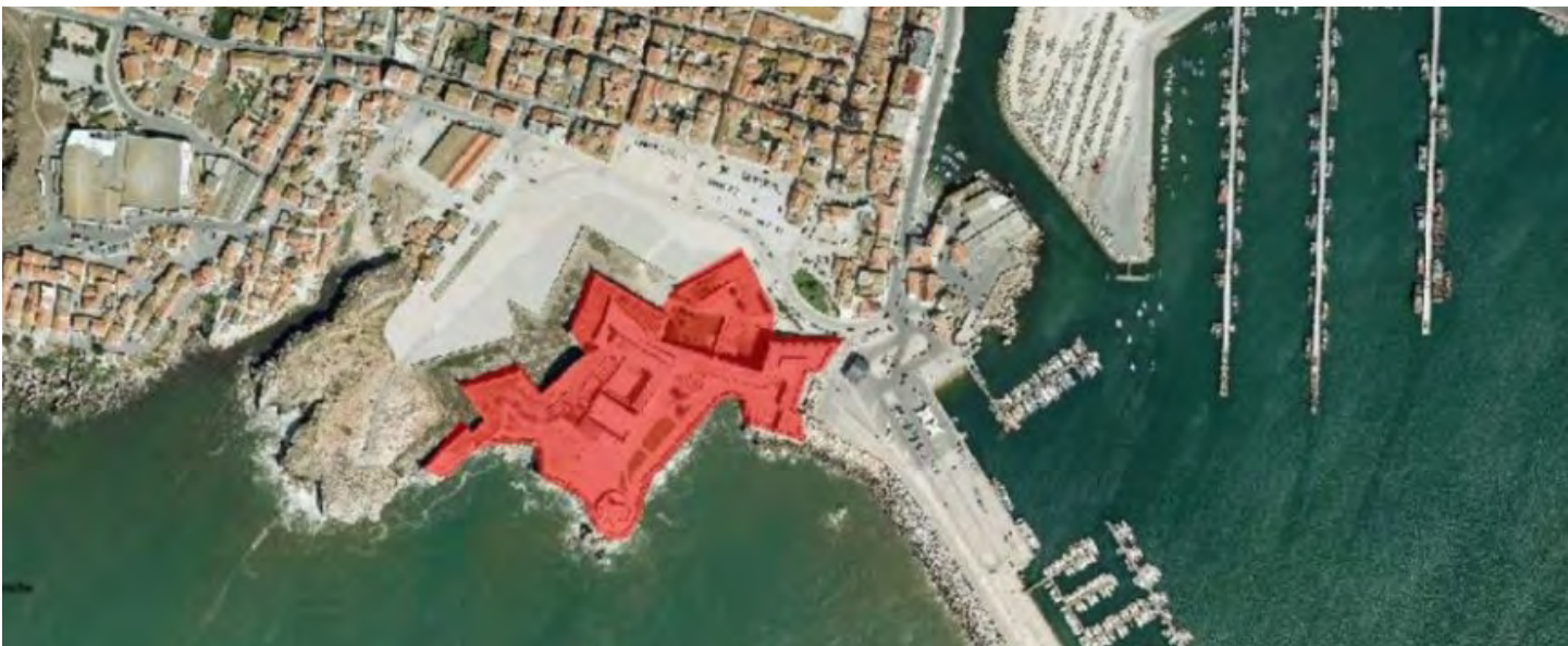
Museu Nacional Resistência e Liberdade tem prevista inauguração para abril