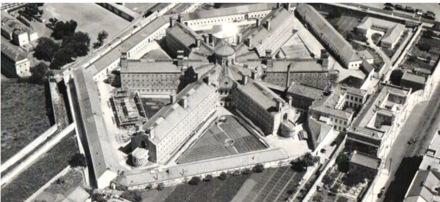
Estabelecimento Prisional de Lisboa vai ser encerrado

Foi assinado o protocolo com a Câmara Municipal de Castelo Branco que vai permitir a instalação do Tribunal Central Administrativo do Centro. É o terceiro TCA criado, 20 anos após a entrada em funcionamento dos TCAs do Norte e do Sul e será fundamental para a diminuição das pendências na 2ª instância da jurisdição administrativa e fiscal, contribuindo para aumentar a eficiência da resposta da justiça económica.