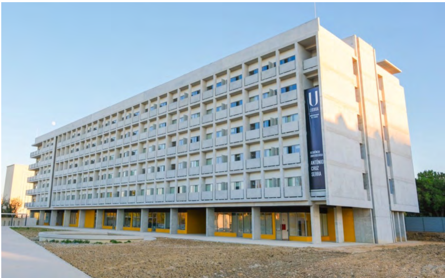
Residência António Cruz Serra integra o programa das novas residências universitárias