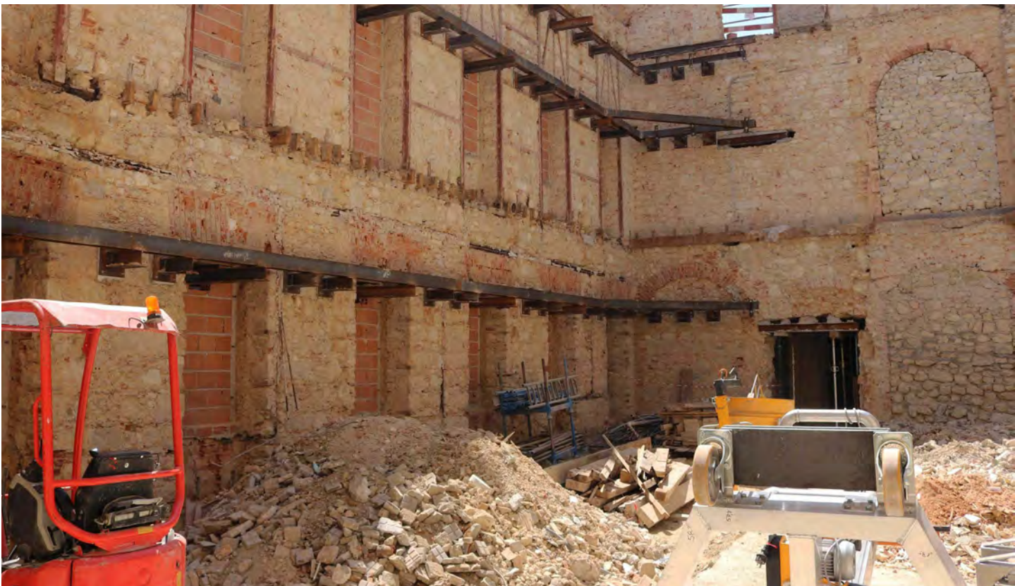
Obras em curso nas Escolas Artísticas de Música e Dança do Conservatório Nacional