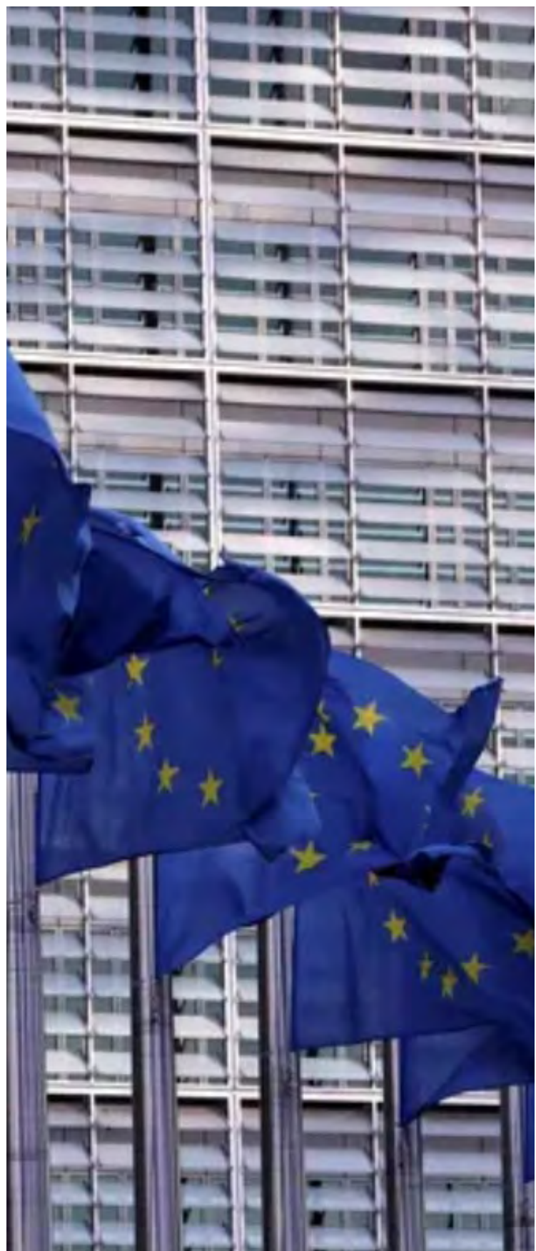
Portugal está nos primeiros lugares do ranking da execução dos fundos comunitários

Já foram lançados 328 avisos, envolvendo mais de 5 mil M€ de fundo europeu. Existem 731 operações já aprovadas a que correspondem 963M€ de fundo aprovado, 429M€ de fundo executado e 71 M€ de fundo pago.