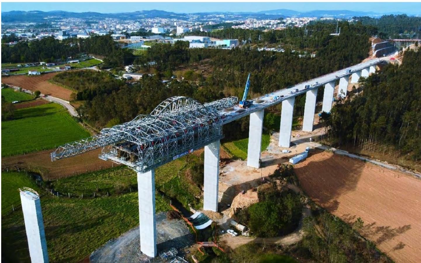
Obras na EN 14