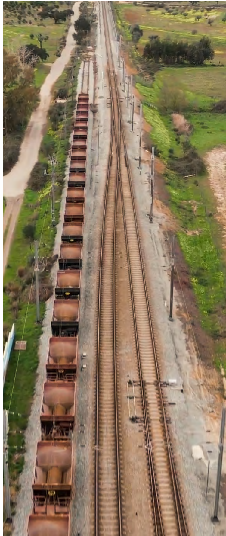
Corredor Internacional Sul já tem novos troços concluídos

Com 80 km de linha nova e 90 km de linha renovada, o CIS vai ligar os portos de Sines, Lisboa e Setúbal a Espanha, encurtando a distância entre Sines e a fronteira em três horas e meia.