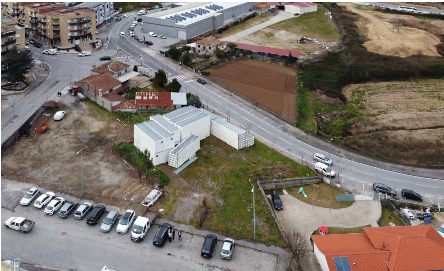
Projeto do Programa de Arrendamento Acessível em Lousada