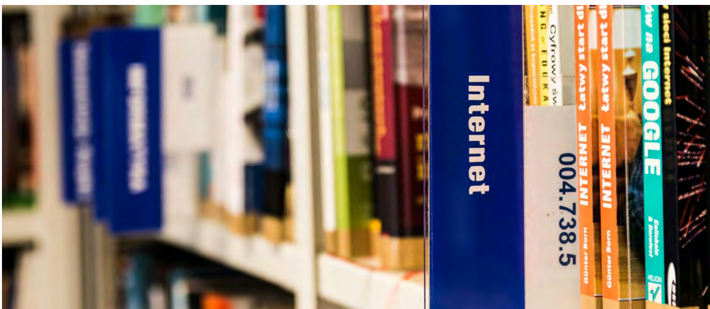
Novo Contrato de Legislatura para o Ensino Superior

O novo contrato cria também as condições adequadas para apoiar a contratação por tempo indeterminado de doutorados exclusivamente para a carreira de investigação científica bem como para promover a vinculação de 1400 investigadores nas carreiras docentes e de investigação, aprofundando a visão assumida desde 2016 sobre as relações laborais estabelecidas na comunidade científica, que assumiram o contrato de trabalho como o regime regra para a contratação de investigadores doutorados.