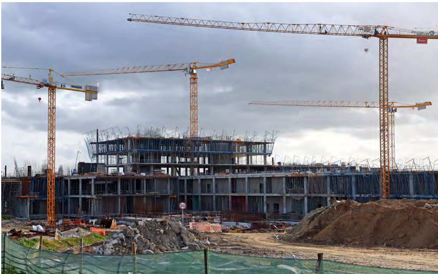
Obras de construção do Hospital Central do Alentejo