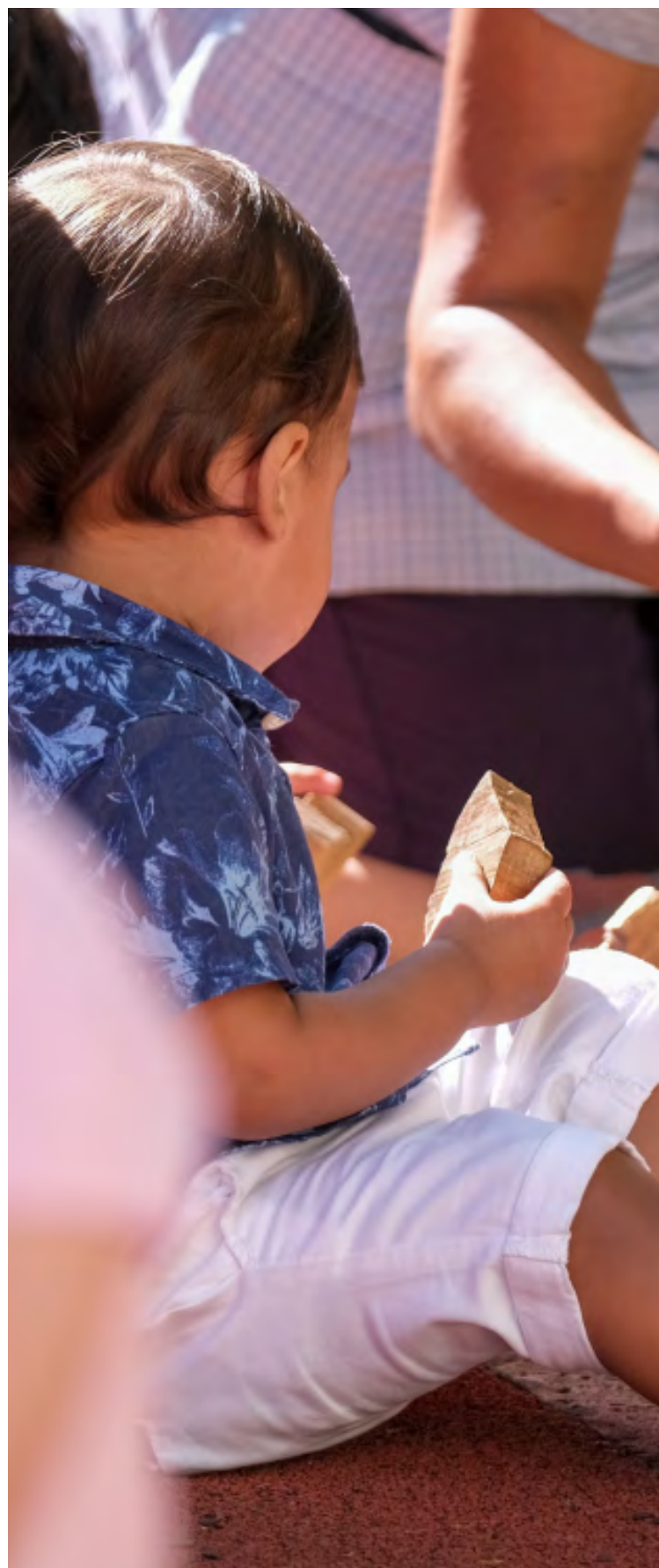
Mais 15.361 lugares em creches em execução