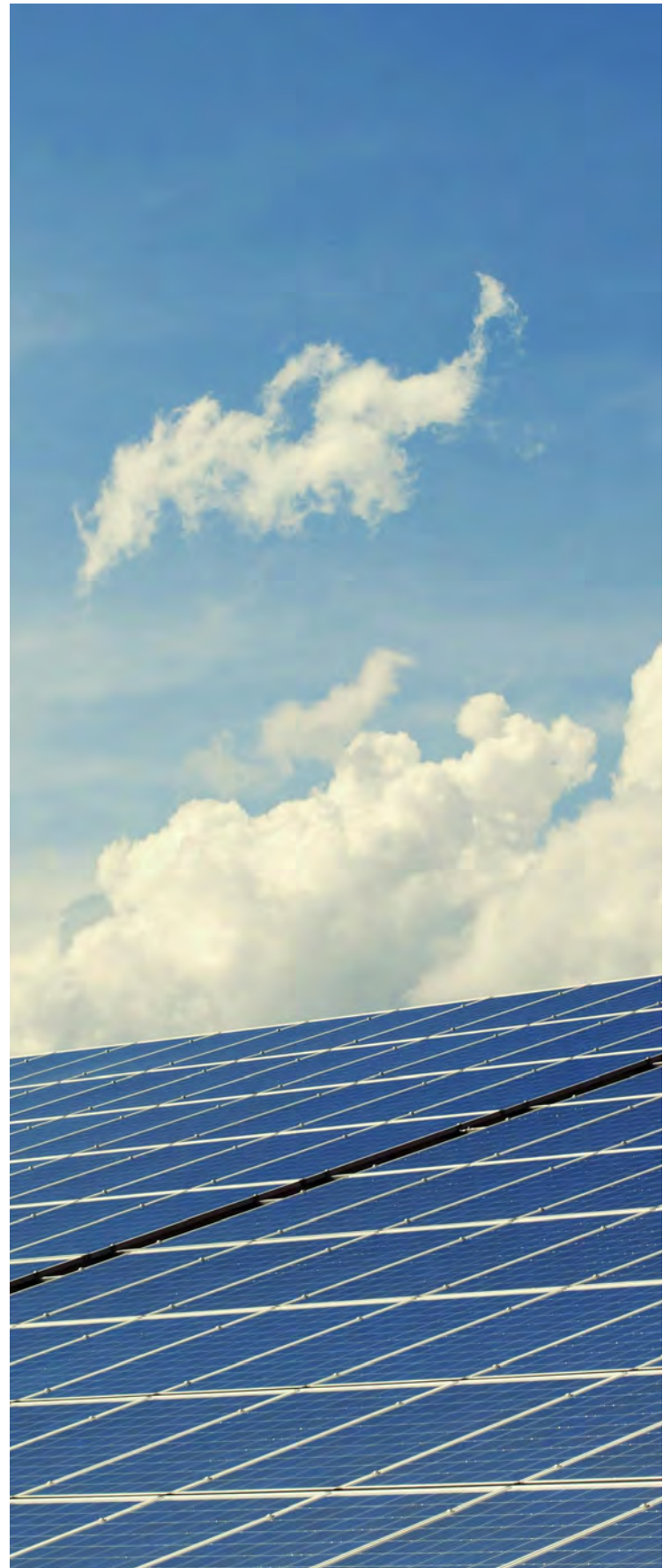
Investimento em energia de fonte renovável

De modo a potenciar a nova fileira dos gases renováveis, de elevado valor acrescentado e potenciadora da descarbonização do país será lançado um leilão de compra centralizada de biometano e hidrogénio.