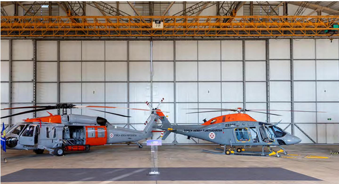
Dois novos helicópteros para combate a incêndios serão entregues este ano