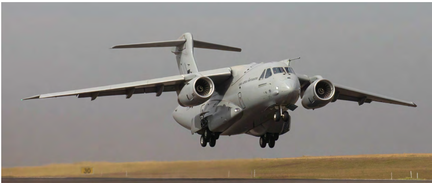
Aquisição de cinco KC-390