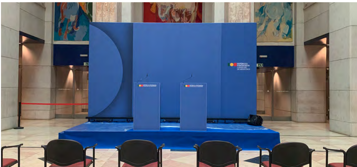
Conselho de Ministros de 25 de março realiza-se no Campus APP

Após a fase de análise de candidaturas e processos de audiência de interessados, na semana de 4 a 8 de março, foram elaboradas e publicadas as listas finais de admitidos e excluídos. Nas mesmas datas foram remetidas as convocatórias para a prova de conhecimento a realizar entre os dias 19 a 22 de março. O apuramento dos resultados de cada prova de conhecimento e a respetiva publicação dos resultados está prevista para o período de 25 de março e 8 de abril, sendo posteriormente efetuadas as convocatórias para as provas de avaliação psicológica.