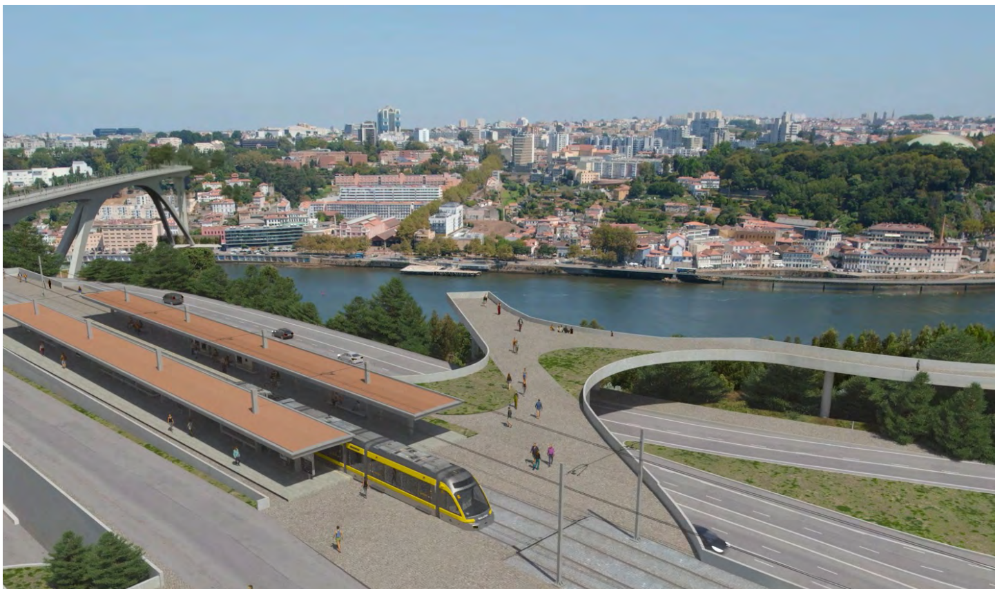
Obras em curso em cinco linhas do Metro do Porto