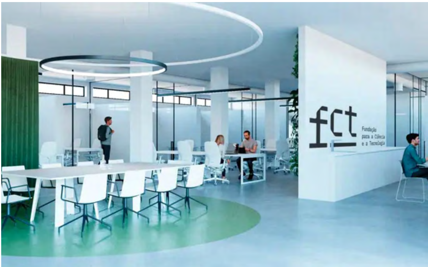
Imagem digital da futura sede da FCT no Campus Ciência XXI